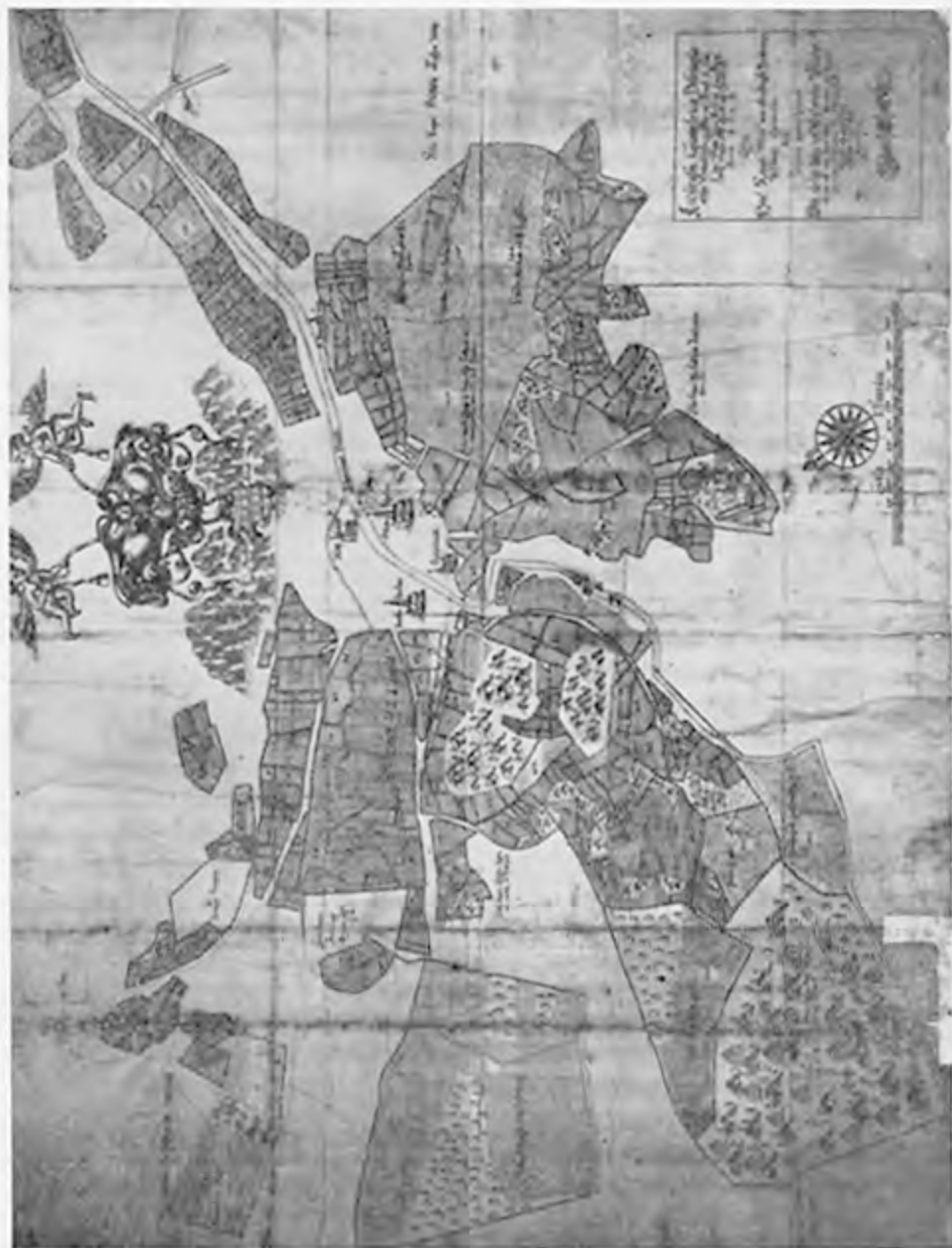
Karta över Söderköpings åker och äng, upprättad 1642 av Johanne Rogier, Geomet.