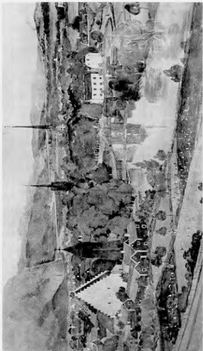
Fig. 1. Söderköping från väster. Akvarell i Uppsala Universitets bibliotek.