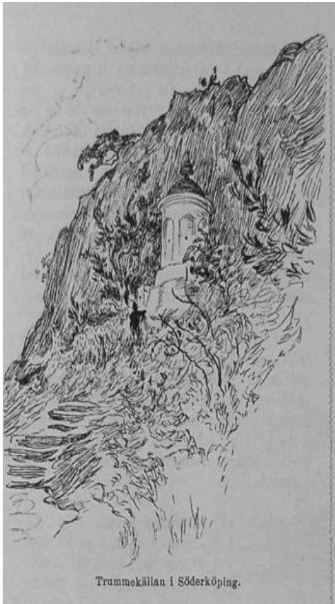
Trammekällan i Söderköping.

Middagen helt apropå, Dukades i en berså; Hin vet hur magen stod bi Med slikt frosseri. Här rådde glädje och skämt. Flaskorna bugade jemt, Och aldrig satt korkarna i.