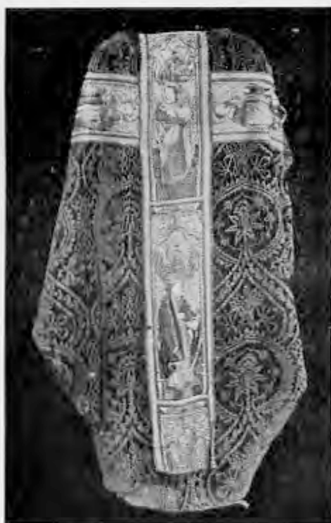
Mässhake från Skönberga kyrka. I Östergötlands museum.

rothea, Barbara, Katarina av Alexandria och Birgitta. Såväl bilden som dörrmålningarna äro framställda i ett grovt, nästan rått manér. Skåpet har antagligen varit