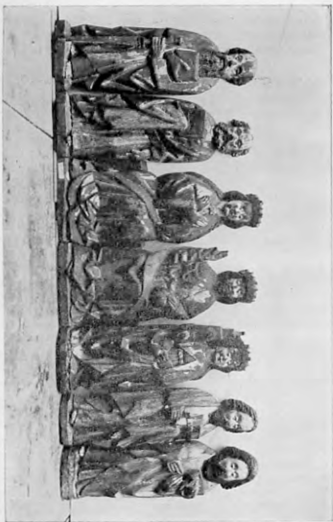
Jungfru Marie kröning. Del av altarskåp, tillhörande Skönberga kyrka. I Ostergötlands museum.