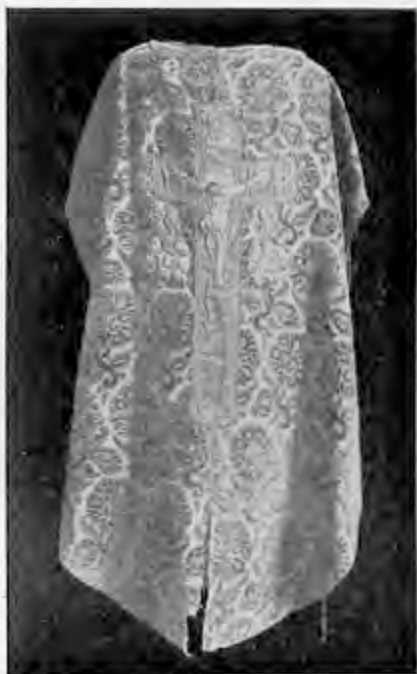
Mässhake från Skönberga kyrka.

Från 1500-talet äger Skönberga en mässhake av svart sammet i granatäpplemönster med rika silkesbroderier å guld- och silverbotten. De utsökt fina broderierna på baksidans kors är antagligen flandriskt arbete och föreställer apostlarna Paulus, Petrus, Mattheus och Thomas. På framsidan äro Bartolomeus och Johannes döparen broderade. Mässhaken är skänkt till kyrkan under 1600-talet av