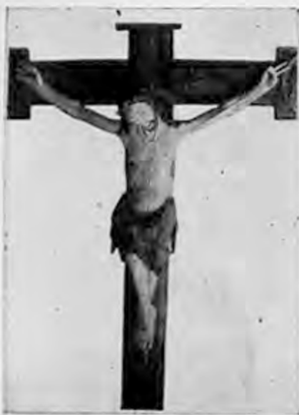
Triumfkrucifix från Skönberga kyrka. Statens historiska samlingar.

De äldsta konstminnen, som kyrkan äger, äro från romansk tid, slutet av 1100-talet eller början av 1200-talet. Det är dels tvenne järnsmidda dörrar, dels märk-