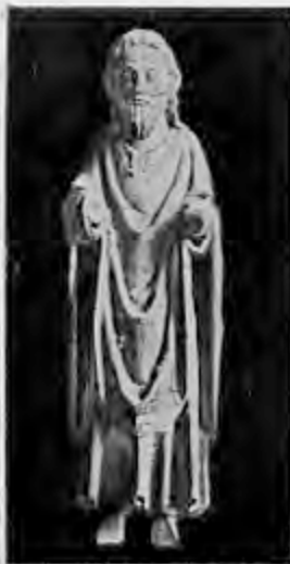
Apostlabilid från Skönberga kyrka, uppsatt i "lillkyrkan".

Bilden renoverades 1925 och återbördades till kyrkan samma år. Med den här avbildade apostlagesalten äro vi inne i höggotiken. Visserligen är bildens raka, framåtriktade ställning en reminiscens från romansk uppfattning, men dräktens mjuka fall, känslan för linjespel, för ljus- och skuggvärden, peka hän på tiden inemot 1400. Även denna bild renoverades 1925 och återbördades till kyrkan, där den jämte S:t Olovsbilden är uppsatt i den s. k. lillkyrkan.