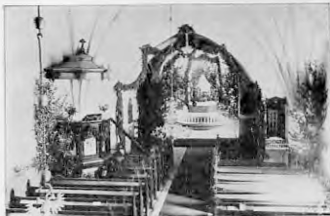
Interiör av Skönberga kyrka.

De flesta konstföremål, som Skönberga kyrka äger, äro från medeltiden. Men innan vi skärskåda de särskilda föremålen, skola vi med några få ord beröra den kristna konstuppfattningen under medeltiden. Konstens syftemål under denna tid inneslutes i ett yttrande i ett välkänt brev av Gregorius den store. Han säger: »vad