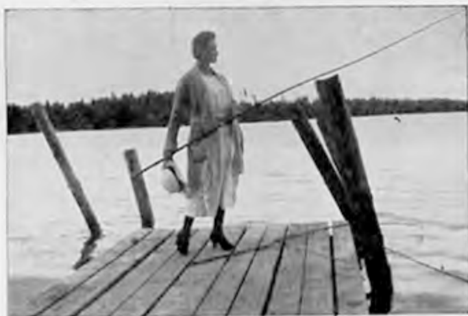
Fiske i Hallebysjön.

Det ståtliga godset Halleby, vid den leende insjön med samma namn, vars innehavare i senare tid en gång voro bl. a. Tessin, Wrede och Sparre; det vidsträckta och lummiga Skörtinge, där en Klingspor och