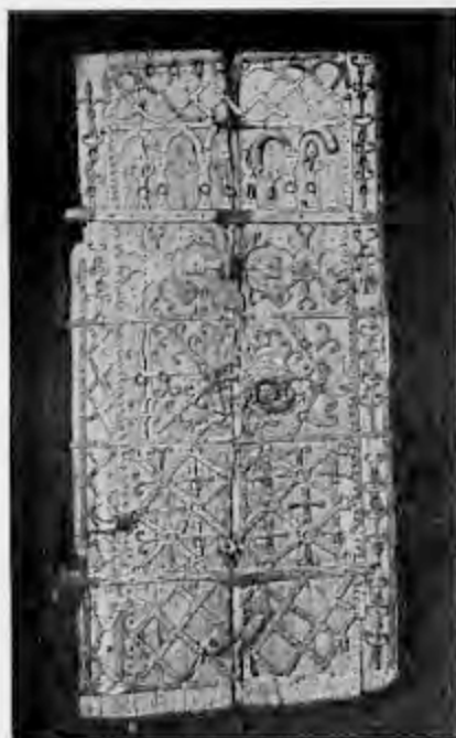
Dörr från Schönberga kyrka. Östergötlands museum.

Från början av 1700-talet, barockens konstepok, har kyrkan ägt ett minnesmärke och det var den gamla predikstolen från år 1723, som på 90-talet forslades till