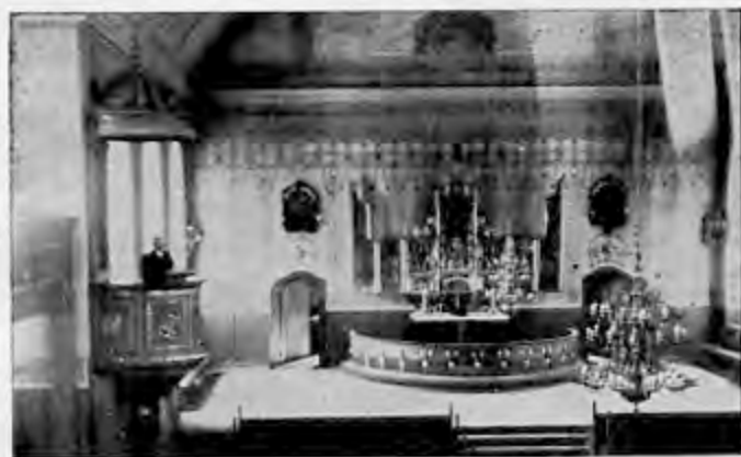
Interiör av Skärkinds kyrka.

tion nämner, att det skett redan på 1200-talet. Den var i bruk till år 1836 och blev nedriven 1844, varvid emellertid kortillbyggnaden bibehölls som gravkapell. Här är minnenas helgade mark. Här förvaras bl. a. förutnämnda Skäras revben med runinskrift samt en mycket gammal rikt utsirad dopfunt av kalksten, ett