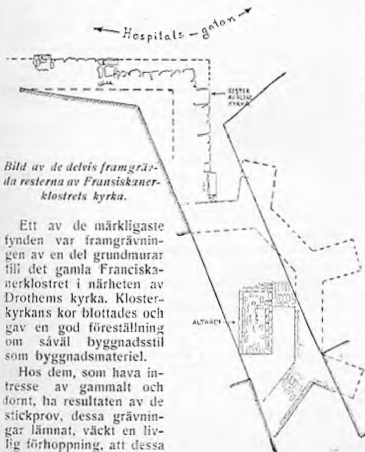
Bild av de delvis framgrävda resterna av Fransiskanerklostrets kyrka.

Angående stadsplanen och dess förändringar under olika tidsskeden ha de gjorda grävningarna lämnat talrika och värdefulla upplysningar.