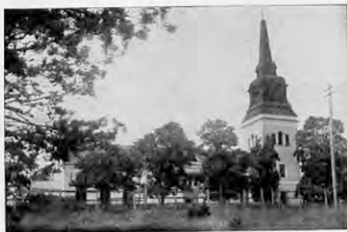
Exteriör av Skärkinds kyrka.

Det är gammal, förnämlig kulturbygd denna Skärkinds socken, ja, en av Östergötlands allra äldsta, och den har också givit såväl häradet som kontraktet sitt