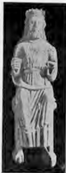
S:t Olof från Skönberga kyrka, uppsatt i "tillkyrkan".

Skönberga-krucifixet räknas. Korset har den ansevärd höjden av 3,56 m., och har antagligen suttit på väggen ovanför triumfbågen, innan valven slogos, alltså över de förut nämnda romanska målningarna och stående på en bjälke, som suttit mellan de båda bågfästena. Bilden visar en ädel måttfullhet i framställningen och kroppsdelarna äro realistiskt skulpterade utan störande överdrifter. Ländklädet är typiskt gotiskt med långa nedhängande sidoflikar. I korsets slutändar är anbragta kvadratiska skivor, vari äro infällda cirklar, som bära de kända fyra evangelistsymbolerna: en ängel eller människa för Matteus (Kristi mänskliga natur), ett lejon för Markus (kraften till underverk), en ox för Lukas (försoningsgärningen) och en örn för Johannes (Kristi gudomliga natur).