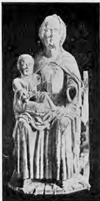
Madonna från Skönberga kyrka.

rades gärna på grund av deras stora helighet. Möjligt är också att detta original befunnit sig i ett S:t Olovskapell i Söderköping. S:t Olov avbildades i allmänhet efter två typer; den ena är som Skönberga-bilden, sittande med yxa i den ena handen och riksäpplet i den andra; den andra typen föreställer helgonet iklädd rustning, stående eller trampande på trollet Skalle (en bild av hedendomen). En sådan bild finnes i Söderköpings kyrka. Olov var Norges konung mellan åren 1015—1030; han lät döpa sig i Rouen och utbredde därefter kristendomen i sitt land. Han byggde kyrkor och utrotade hedniska bruk, vilket går igen i folksagan om hans härfärd mot »trolle» på ett fartyg, som kunde segla både över vatten och land. Olov stupade i slaget vid Stiklastad år 1030 och hans gravplats i Trondhjem blev Nordens mest besökta vallfartsort. Hans vanligaste attribut är den yxa, varmed han vid Stiklastad erhöi dråpslaget; andra attribut peka på hans missionerande arbete för hedendomen, såsom en kalk, eller under hans fötter, en mansfigur eller drake, symboler för den övervunna hedendomen.