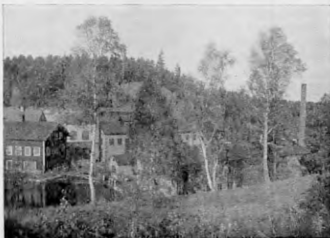
Parti av Gusums bruks byggnader.

Det dallrar toner av enkel och varm fromhet genom dessa enkla versar och hoppfull evighetslängtan.