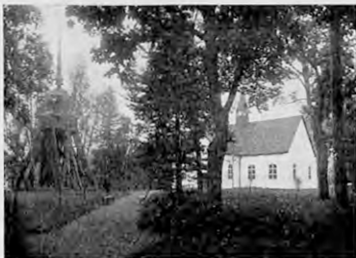
Gusums kyrka med klockstapel.

sträckt sin spira mot höjden under ett och ett halft århundrade nämligen från 1777, då den gamla stenkyrkan från 1500-talet ombyggdes och utvidgades, fastän den under tidernas lopp krävt tid efter annan gjorda reparationer och förändringar.