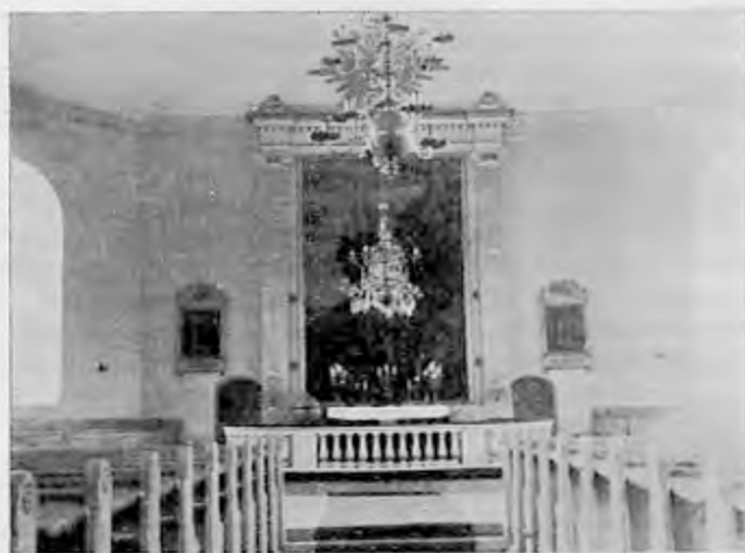
Interiör av Ringarums kyrka.

I ett protokoll från 1846 omnämnes att Valdemarsvik skaffat sig egen barnalärare. Årtiondena gå framåt. Valdemarsvik begär att få eget skolhus. Den flyttande skolan hade förut alternerat mellan Rullerum, Valdemarsvik, Sverkersholm och Häggebo, eventuellt i andra byar.